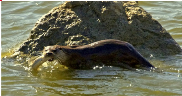
Figure 1. Specimen of Neotropical otter Lontra longicaudis annectens in the estuary Boca Negra, Jalisco, Mexico.

On March 15th, 2014 at 10:00 h, while performing the sample collection of a doctoral thesis about the distribution and abundance of the prawn Macrobrachium tenellum in the estuary Boca Negra, Jalisco, the presence of Neotropical otter L. l. annectens was recorded for the first time in this estuary system (20° 40' 10.84'' N, 105° 16' 11.86'' W; 7 m a.s.l.) (Figures 1 y 2). After that, two pieces of feces that belong to this species (Aranda, 2000; Aranda-Sánchez, 2012) were found in a projecting rock in this coastal wetland.